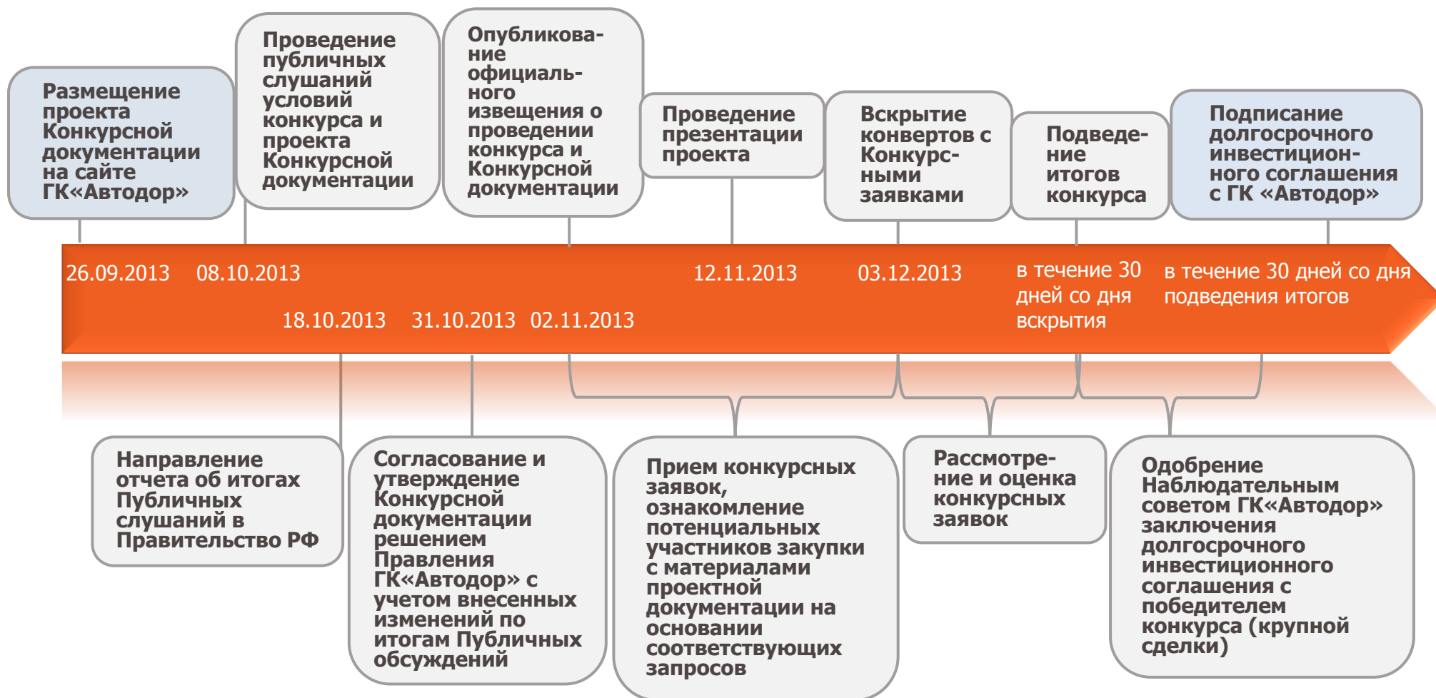
График проведения открытого конкурса